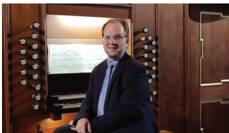
Kantor Ronny Vogel

Zwischen den Konzerten ist der Fußweg eingerechnet, sodass es jeder zu den Konzerten schaffen kann. Als Abschluss sind Sie herzlich zu einem kleinen Imbiss eingeladen!