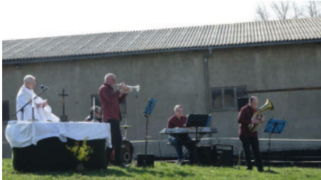
Ostergottesdienst mit Segen für Mensch und Tier