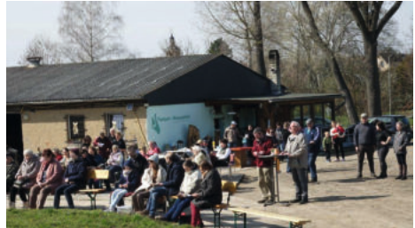
Ostermontag: Gottesdienst auf der Ranche „Tierisch-Menschlich“