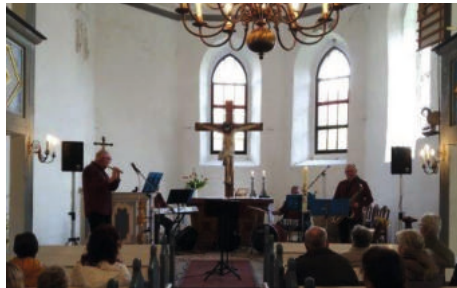
Kirche St. Georg, Frühlingskonzert