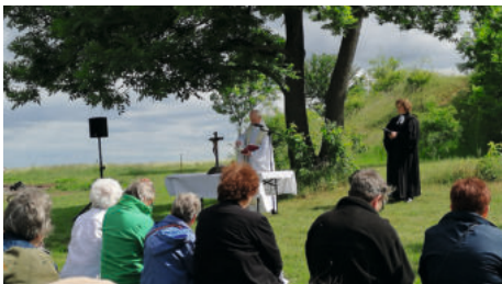
Himmelfahrtsgottesdienst auf dem Sperlingsberg