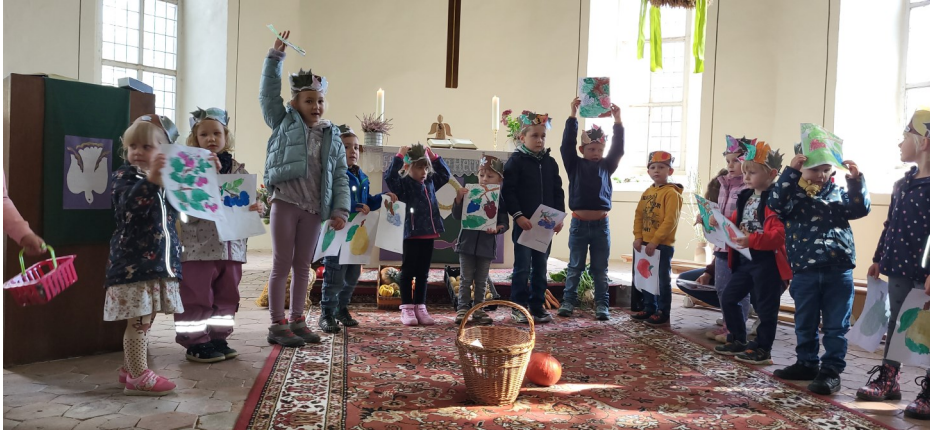
Kinder der Kita Kleeblatt in der St. Christophorus-Kirche zu Wellen